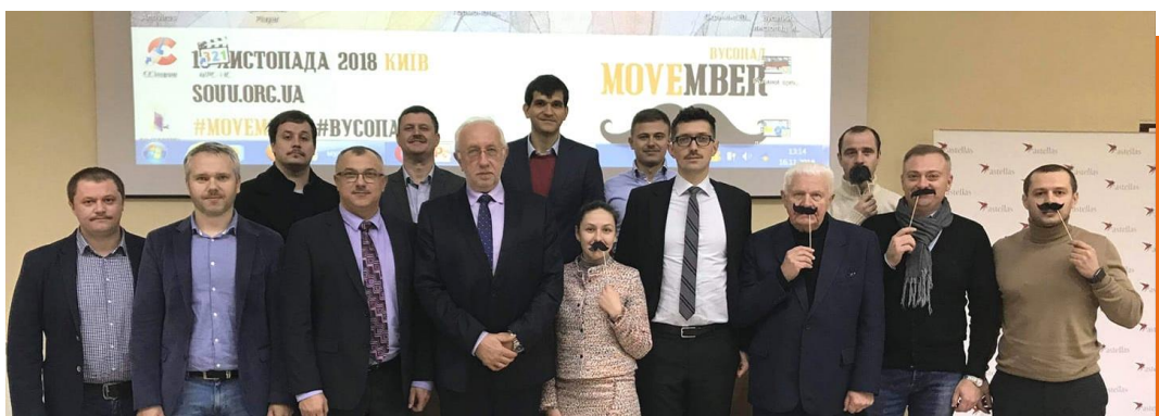
Фото з Мовемберу-2018. Онкоурологи з «вусами»

В УКРАЇНІ ЦЕ БУДЕ ВЖЕ 9-Й «ВУСОПАД» - ПРИЄДНУЙТЕСЬ ДО ЦІЄЇ АКЦІЇ РАЗОМ З НАМИ!